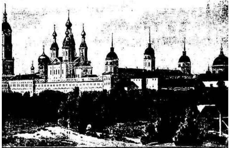
Mănăstirea Sarov. Vedere din partea de sud.